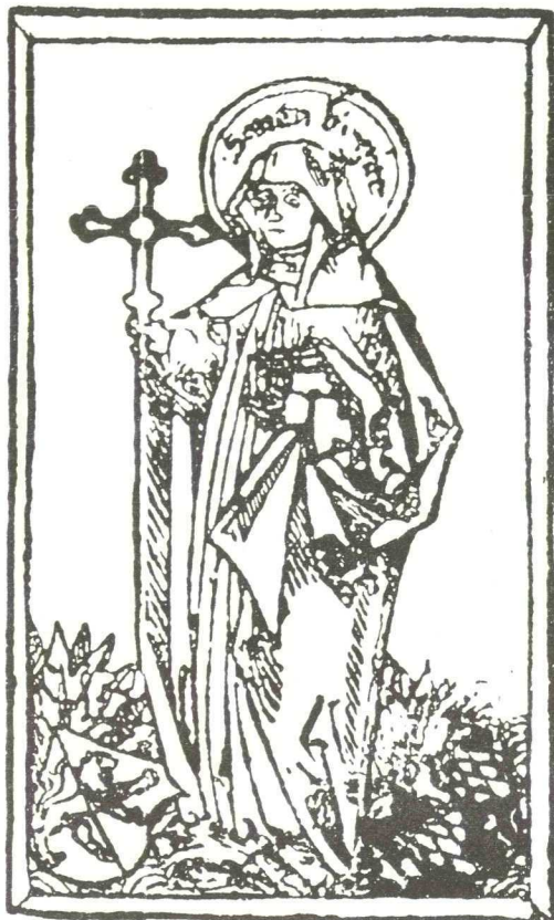
De Heilige Birgitta van Zweden (ca. 1310 - + 23 juli 1373 te Rome). Houtsnede uit het einde van de 15de eeuw.

Op zijn tocht door Soest plunderde en vernietigde hij alles wat hem niet zinde. Het klooster Mariënborg wordt voor een groot deel vernield, geplunderd en in brand gestoken. Daarna trekt hij naar Amersfoort en wordt op 6 juni 1543 meester van de stad en de bevolking. Door de betaling van een afkoopsom van FL. 80.000 bleef Amersfoort van plundering en verwoesting bespaard.